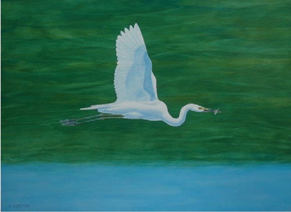
Ett 50-tal ägretthäger har påträffats i Västmanland sedan 1976. Arten har en vid utbredning och är expansiv i Europa. Den långsiktiga trenden är att denna häger kan bli mer allmän i Sverige. Målning av Gunnar Forsman med inspiration från Storsund, Gotland.